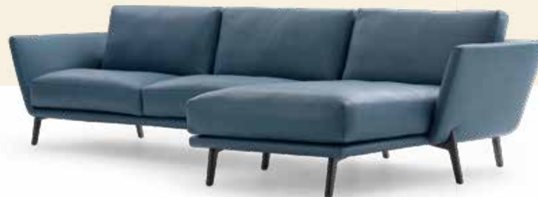
Leolux Rego Design: Gino Carollo, 2020

Wij tonen een ruime collectie in een herkenbare Leolux studio. Je bent hier beland bij een specialist, met de nieuwste modellen en actuele kennis van zaken.