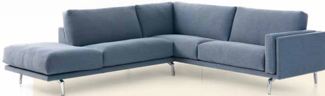
Leolux Bellice Design: Beck Design, 2017