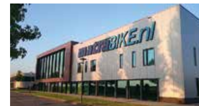
Matrabike Experience Center Waalwijk (NL)

Antwerpsestraat 83, 2840 Reet (gemeente Rumst), België. Tel. 03 888 09 90