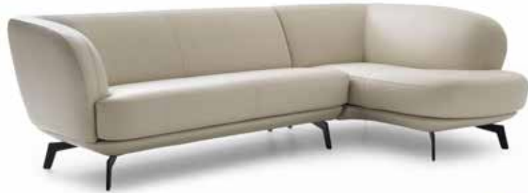
Leolux Flint Design: Beck Design, 2019